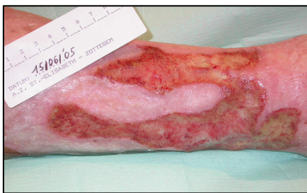
Uiterst pijnlijk veneus ulcus Aanpassing verband en pijnstilling

In de praktijk houden we er rekening mee dat elke wond pijnlijk is of tijdens het wondhelingsproces zelfs meer pijnlijk kan worden. Ook de wondomgeving kan gevoelig tot pijnlijk zijn. De definitie 'Pijn is wat de patiënt zegt wat pijn is' moet heel ernstig genomen worden. We moeten er ook rekening mee houden dat sommige patiënten hun pijn niet kunnen of durven verwoorden. Sommige