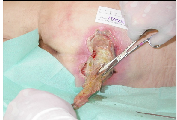
Decubitus wond : 1 uur vooraf werd \frac{3}{4} amp Dipidolor gegeven

Nergens beter dan bij een diabetes neuropathische voet zien we het belang van de pijn als signaalfunctie. Hoewel een aantal diabetici soms een prikkelend, stekend tot branderig gevoel hebben, zien we heel wat wonden optreden omdat de pijnsensatie totaal verstoord is. Een doorgedreven preventie en controle van de diabetes voet is noodzakelijk om dramatische situaties te voorkomen.